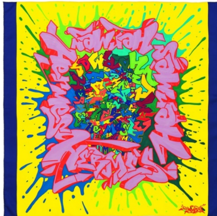
The Graff Hermès silk twill carré designed by Kongo Khăn Choàng nữ bằng lụa do Kongo thiết họa

đi. Sao gặp ai thì cũng hàn huyên được vậy. Ở đây thì họ cũng sẽ kể đủ chuyện mà thôi – toàn chỉ là một đám ham nói, mà lại còn chỉ biết nói láo mà thôi. Anh có biết không? Thăng cha đó chỉ muốn có được một chiếc mũ do bạn tô điểm, vậy thôi". Nhưng cái ông bạn hiền này quả là quá ư sai lầm. Đôi lúc, lịch sự với người dung thì rốt cuộc cũng rất ư là đáng giá.