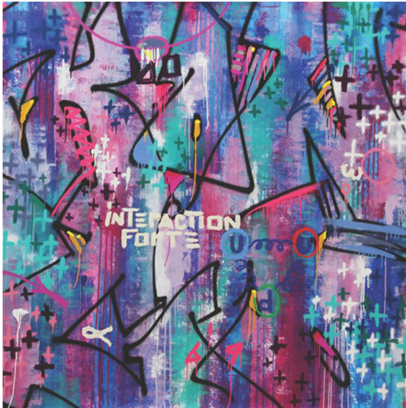
Interaction Forte, mixed media, 160 x 160 cm, 2015 Liên Tác Mạnh, nghệ thuật hỗn hợp

Sau một lớp 'acrylic' Gesso cực mịn (làm nền để tranh sẽ khỏi bị nứt) hầu chuẩn bị các khung tranh sơn được căng bằng 'linen ~ vải gai' (vải gai là một vật liệu trường tồn mà không tan rã hay bị đóng mốc), ông vẽ với các loại 'acrylics' hiệu Lasco hay hiệu Goldenhay, hay với các bình sơn xịt hiệu MTN, để rồi kết thúc các tác phẩm nghệ thuật với một lớp phủ Capaplex không màu và một chất sơn dầu bằng 'satin'. Ông giới thiệu các khung bằng gỗ quá khổ nhằm phù hợp với loại tranh của ông, mà có thể lại kéo căng ra chỉ bằng một cái nút thật là đơn giản, nếu bức tranh bị méo hay bị chùn lại.