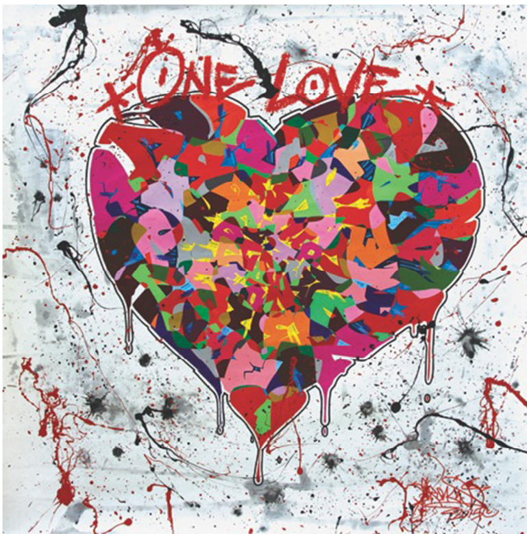
One Love One Destiny, mixed media, 120 x 120 cm, 2015 Tự Thương Bản Mệnh, nghệ thuật hỗn hợp

một đối tượng tầm thường hàng ngày và biến nó thành một tác phẩm nghệ thuật, như cái bức tường xây bằng than khối cũ mềm được dựng lên chỉ để giấu sự nghèo hèn để rồi biến nó thành một cái gì đó mà sẽ giúp cho cuộc sống tươi mát đẹp hơn nhiều. Tuy nhiên, nghệ thuật 'graffiti ~ vẽ tường' thì lại không phải là một cái gì đó mà bạn có thể đơn giản nghiền ra được, để rồi từ ngày này đem dùng cho một ngày khác. Phải mất rất nhiều năm để một nghệ sĩ 'graffiti' mới có thể khám phá ra được bản sắc tạo hình của mình, rồi cày cục từ từ dựng nên cái thế giới đặc trưng cho toàn bộ những tác phẩm của mình. Bắt đầu sự nghiệp của mình như là một nghệ sĩ tự học gần 30 năm trước đây, phong cách của Kongo là kết tụ của bao năm kinh nghiệm vẽ tranh 'graffiti' trên đường phố. Chính những cái chữ đó, mà đã từng là một vấn đề cho người nghệ sĩ thời còn là học sinh, lại đã trở thành nguồn cảm hứng, cái đề tài gợi hứng cũng như là quan niệm nhân sinh của ông, và bây giờ thì người nghệ sĩ vẫn đang cứ thách đố chơi đùa với chữ nghĩa để xem rốt ráo tận cùng, rồi sẽ ra sao?