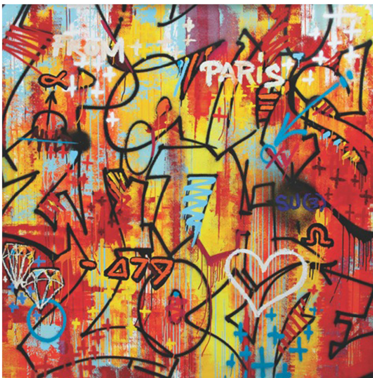
Ville de Lumiere, mixed media, 160 x 160 cm, 2015 Đô Thị Ánh Sáng, nghệ thuật hỗn hợp

Khi vẫn còn là một nghệ sĩ trẻ thôi thì các sáng tác rất ư là đầy đặc tính nổi loạn của ông cũng đã tràn ngập các mặt tiền và tường vách từ Ba-lê tới Nữu-ước, rồi Ba-tây và Hồng-kông. Dạo đó, nghệ thuật ‘Graffiti’ đã không dễ dàng được chấp nhận và bị coi là một hình thức phá hoại vào giữa thập niên 80, do đó ông đã gặp rắc rối với cảnh sát. Tuy nhiên, sau bao nhiêu năm cứ tiếp tục bị nhận giấy phạt vạ, nhà nghệ sĩ vẫn chưa bao giờ từng chịu chấp nhận nghệ thuật ‘graffiti’ như là một hình thức phá hoại, nhưng lại như chính là một món quà, do từ việc mình đã chỉ vẽ trên những bức tường cũ, đã tự mua nguyên liệu, đã tự nguyện cống hiến thời giờ làm việc và đã làm đẹp dùm thành phố bằng một công trình nghệ thuật mà công chúng có thể chiêm ngưỡng miễn phí được. Theo thời gian, môn ‘graffiti’ đã trở thành một hình thức nghệ thuật đường phố của cộng đồng và chính quyền cũng đã nhận ra được khía cạnh tích cực và đã bắt đầu hợp tác với các nghệ sĩ trong việc sáng tác. Kongo đã chuyển từ đường phố vô đến bảo tàng viện vào năm 1991 khi ông triển lãm chung với bạn bè tại Trung tâm Pompidou ở Paris (lúc đó, họ hãy còn rất trẻ, lại ngây thơ nhưng tự tin, cũng như đã không nhận ra được tầm quan trọng được triển lãm tại cái viện bảo tàng nghệ thuật lừng danh đương thời này), để rồi sau đó, họ cũng cùng nhau tổ chức nhiều buổi triển lãm khác, nhưng chỉ mãi 20 năm sau, vào năm 2011, thì ông mới đã tổ chức cuộc triển lãm riêng đầu tiên của mình tại một phòng trưng bày nghệ thuật.