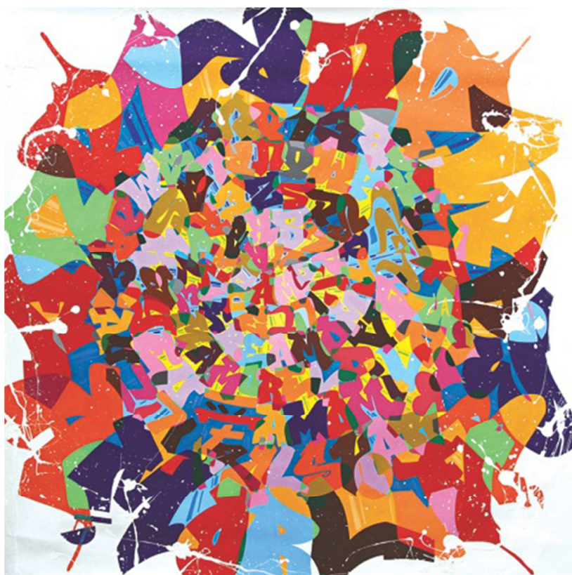
Amour Sans Frontiere, mixed media, 120 x 120 cm, 2015 Tình Yêu Vô Biên Giới, nghệ thuật hỗn hợp