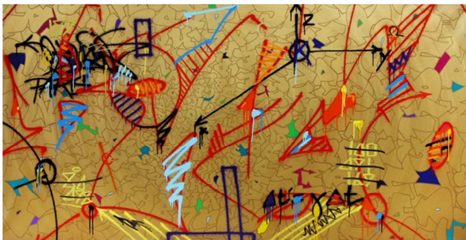
Time Dilation, mixed media, 100 x 200 cm, 2015 Sự Co Giãn Của Thời Gian, nghệ thuật hỗn hợp