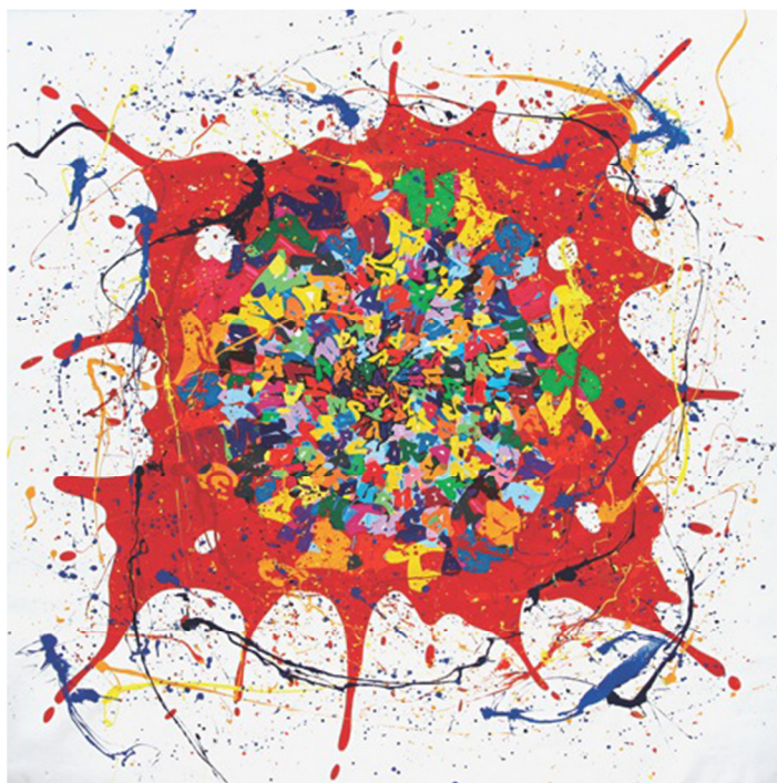
Hara-Kiri, mixed media, 200 x 200 cm, 2015 Tự Sát Nhật Hara-Kiri, nghệ thuật hỗn hợp